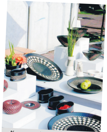
Kann man immer gebrauchen: Teller, Vasen oder Schalen mit schlichtem oder farbig gestalteten Dekor sind in jedem Haushalt ein echter Hingucker.