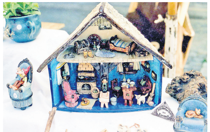
Fast schon zu schön, um damit zu spielen: Diese Puppenstube aus Keramik wird auch auf dem Dammer Töpfermarkt angeboten.