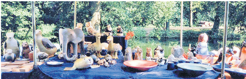
Diese Tierfiguren lassen nicht nur Kinderherzen höher schlagen. Sie eignen sich als Blickfang im Haus, auf der Terrasse oder im Garten.

Wie immer ist auch für die passende musikalische Unterma- lung gesorgt. Mit Klavier, Gitarre, akustischem Bass und Gesang wird die Band „K-Dur“