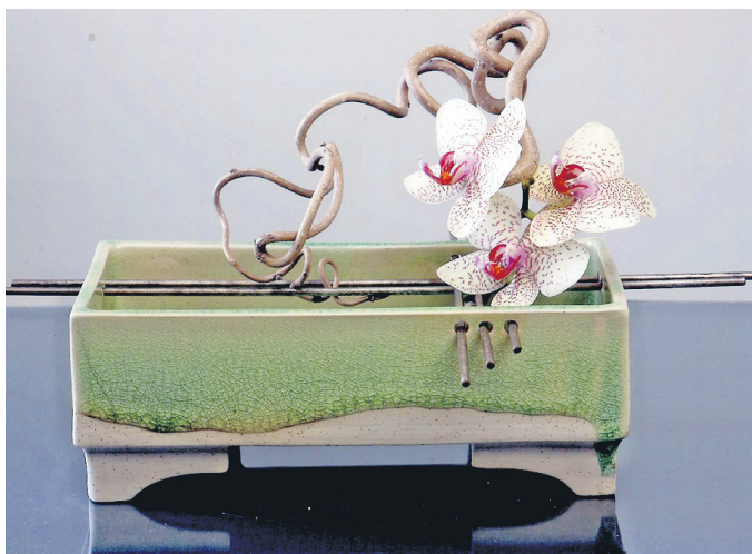
Praktisch und schön in einem: Wer Akzente für das eigene Zuhause sucht, wird auf dem Dammer Töpfermarkt mit Sicherheit fündig.