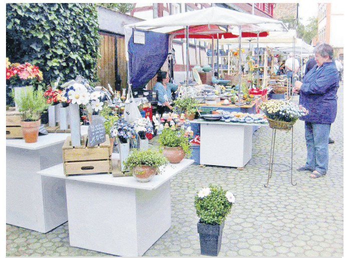
Diese filigranen und dekorativen Blumen sind äußerst pflegeleicht – und halten länger als einen ganzen Sommer lang...