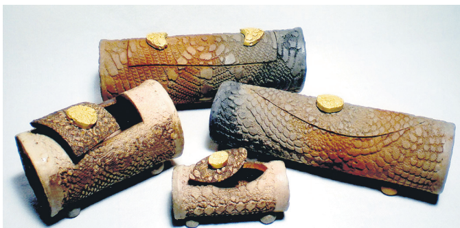
Hier sind vier Dosen, gebaut aus weißem Steinzeugton, zu sehen. Die Tonplatten haben eine textile Prägung. Die Deckelknäufe sind mit Goldeinbrand verziert. Hergestellt im Salzscharzbrand.

aus Osnabrück mit Sicherheit den richtigen Ton treffen, um die Besucher in ihren Bann zu ziehen.